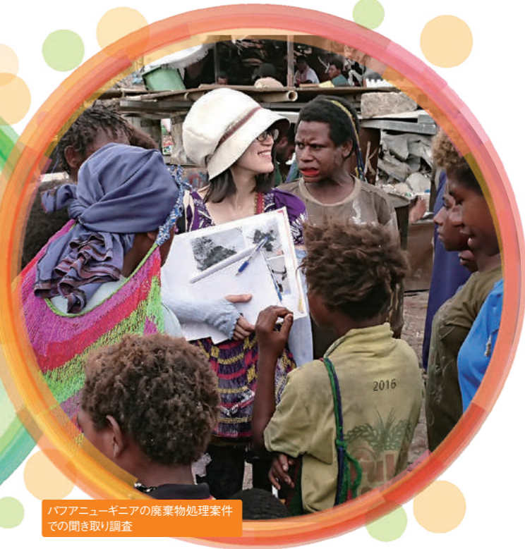
バブアニューギニアの廃棄物処理案件 での聞き取り調査

設立：2001年 資本金：6,000万円 従業員：34人 本社：東京都渋谷区 海外拠点：スリランカ(コロンボ)、ラオス(ピエンチャン)、 ベトナム(ホーチミン) 事業分野：地方創生、中小零細企業開発、 農業農村開発、金融包摂、マーケティング、 海外進出支援 募集職種：開発コンサルタント、 国際ビジネス支援コンサルタント 募集人数：若干名 住所：〒150-0013 東京都渋谷区恵比寿1-3-1 朝日生命恵比寿ビル10階 T e l : 03-5791-5083 M a i l : kmc.admin08@kmcinc.co.jp H P : http://www.kmcinc.co.jp