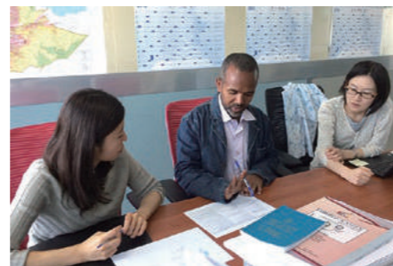
エチオピアの中小企業支援案件での 打ち合わせ

これまでヨルダンで観光開発、パキスタンで女性家内労働者支援、ベトナムやバブアニューギニアで日本の中小企業支援なども担当してきました。これからは観光、ジェンダーの分野で自分の専門性を深めていけたらと思います。やりがいを感じるのは、現場から直接反応が返ってきた時。エチオピアのプロジェクトでは、現場の相談員たちが、「これまで相談にうまく返事できてなかったことがあるが、研修を受けてその解決法が見つかった」と言ってくれました。少しずつでも現場からプラスになることを増やしていけたらなと思います。今後は日本の自治体も視野に入れて、日本と海外をつなぐような仕事にもチャレンジしていきたいですね。